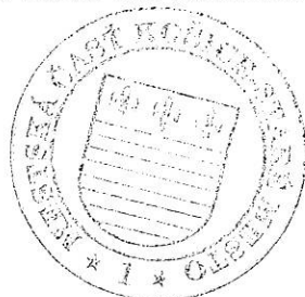
Ing. Igor Petrovčík starosta

Uznesenie miestneho zastupiteľstva č. 151 zo dňa 18.11.2020